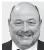
HC Maarup HC Maarup Formand for KKR